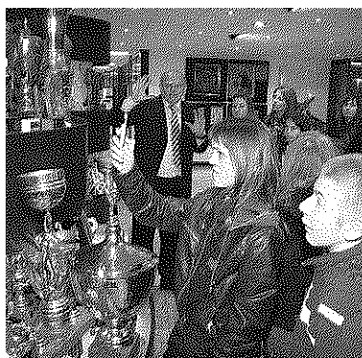
POSETA FK „PARTIZAN“... Klupski trofeji na fotografijama za uspomenu

- Hram je mnogo lep i podseća me na moju Gračanicu, u koju idem za vreme velikih praznika. Posebno mi se svideo veliki krst.