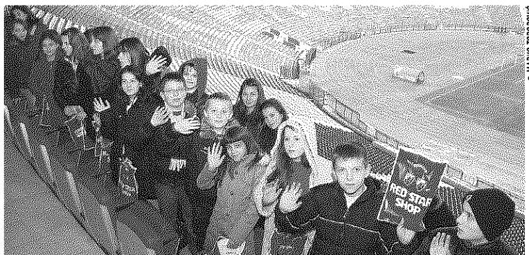
ZAPANJENA VELICINOM STADIONA... Deca na Zvezdinoj „Marakani“